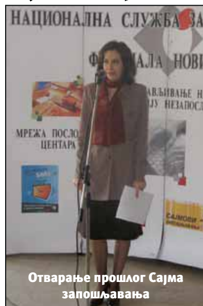
Отварање прошлог Сајма запошљавања

Послодавци су задовољни искуствима са досадашњих Сајмова запошљавања, као и квалитетом радне снаге. Наредни Сајам запошљавања може се очекивати крајем априла и почетом маја. Сајам запошљавања у октобру прошле године је био одлично организован одзив послодавца и незапослених је био велик, али и поред тога, како каже Перић због новонастале ситуације због кризе, није успео. За април је планиран и нови састанак са послодавцима, како би се на лицу места сазнале потребе тржишта рада.