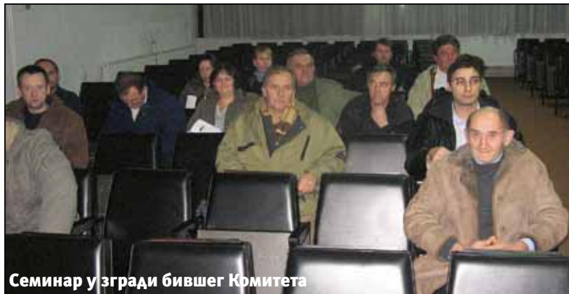
Семинар у згради бившег Комитета

У марту је расписан конкурс за доделу субвенција (бесповратних средстава) малим и средњим